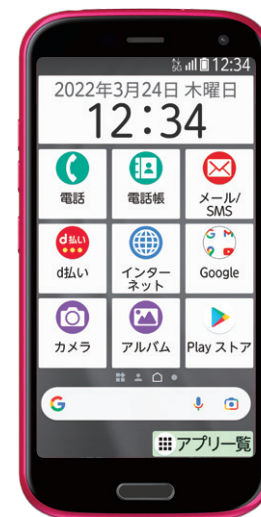
[スマホかんたんモード]

一般的なスマホのように操作できる「スマホかんたんモード」に切り替えも可能。ご家族の方もサポートしやすいモードです。