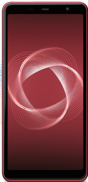
arrows Be4 Plus F-41B