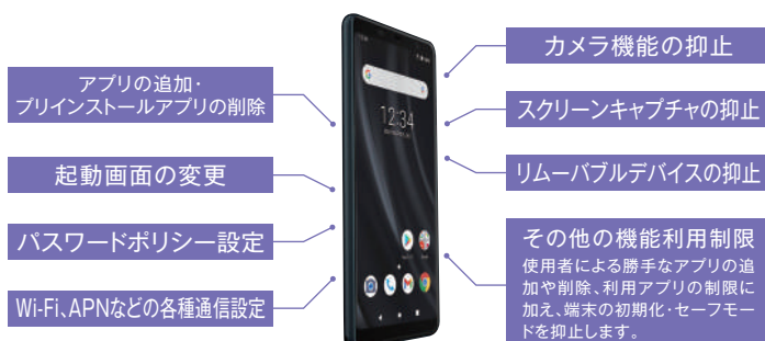
豊富なカスタマイズサービスの一例

ご要望に応じて理想的な端末に仕上げられる「カスタマイズサービス」。機器設定の変更やセットアップ作業はすべて当社側で行うので、納品後すぐにカスタマイズ端末を利用することができます。