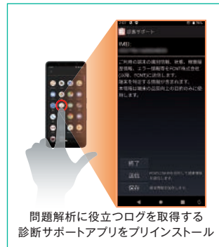
問題解析に役立つログを取得する 診断サポートアプリをプリインストール

原因究明が困難な技術トラブルが発生した際、問題解決をサポートする技術支援サービスをご提供。導入時から運用時にいたるまで、専門技術者が的確なアドバイスで、ご購入から3年間無償でサポートします。